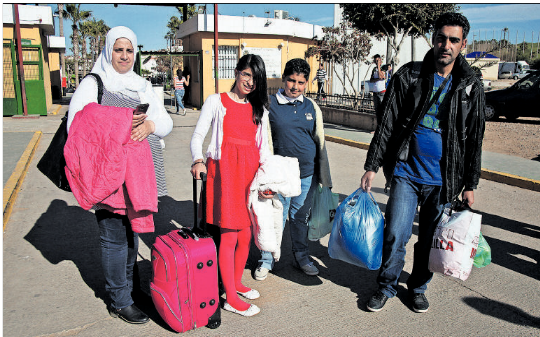
Una familia de refugiados sirios deja el CETI de Melilla hace 10 días para embarcarse en un ferri rumbo a Málaga.

La política de asilo ha estado marcada por una nula voluntad de ayuda. Aunque el sistema de acogida ha mejorado, la mayoría no se queda en el país