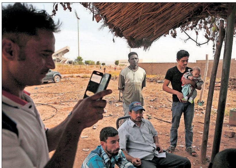
Un grupo de refugiados sirios a las afueras de Bamako (Mali), en diciembre de 2015.

ACNUR concluye que hace falta cambiar el sistema: "Se podría hacer con la solidaridad impresionante de la gente española, con la cantidad de instituciones, regionales y locales, que quieren echar una mano, pero hace falta voluntad política". Hay que enmarcar esta actitud en una perspectiva histórica. "Durante años, España ha hecho la vista gorda a los inmigrantes irregulares y ha recibido siete millones. Pocos países en el mundo han asumido tantos en tan poco tiempo", explica Carmen González Enríquez, del Real Instituto Elcano. Todo cambió con la crisis. Entonces España se tomó en serio la lucha contra la inmigración irregular. Pero no el asilo.